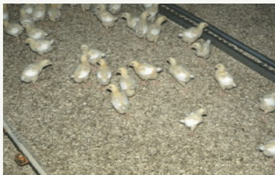
Hampestrøelse er perfekt også til fjerkræ